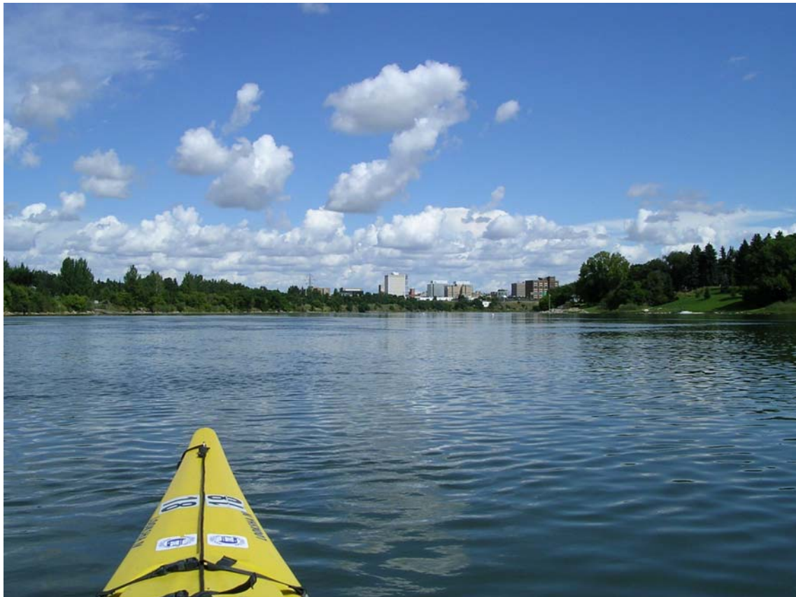
Kurz vorm Bootshaus, Blick auf die Stadt Saskatoon

Ach ja, hier ist noch des Rätsels Lösung: Ka-na-da-gans-ma-ma !!