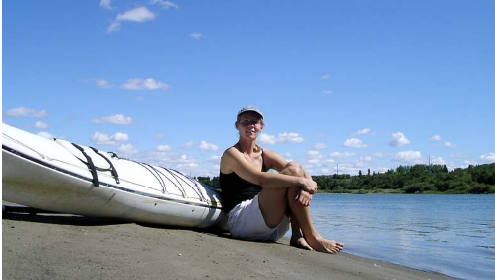
Auf der Sandbank an der Eisenbahnbrücke mit dem Boot #17, ein Squall von Current Design.

Ausser einem kleinen Touristendampfer (Flachbodenböötchen) und ein paar Wasser-Scootern ist nix los an Motorkrach und -booten. Ruder- und Drachenboote, sowie Kanus und Kajaks bestimmen das Bild.