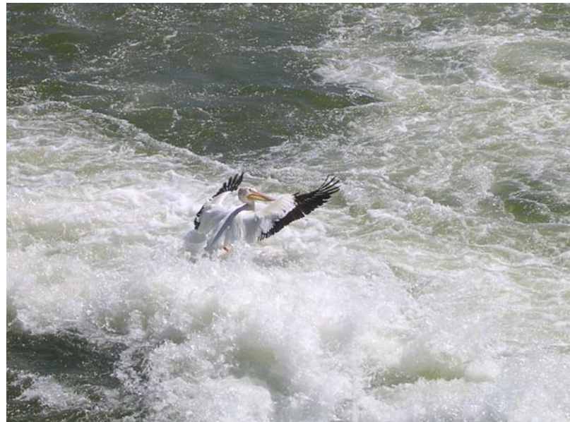
Ein Pelikan beim Fischfang am Wehr in der Innenstadt– da das Umtragen hier sehr schwierig ist, wird meist nur flussauf gepaddelt

Im Dunkeln durch die erleuchtete Stadt zu paddeln, mit den angestrahlten Brücken, ist fast schon romantisch.