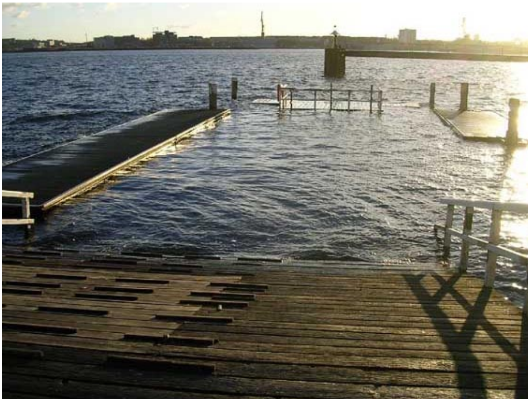
“Land unter“ unseres Steges bei winterlichem Hochwasser

Der erste Frost, Mitte Dezember. Die Eisschicht wächst und wächst, die Hörn ist schon ein gutes Stück zugefroren. Es ist Freitag der Dreizehnte und endlich haben wir, nach all den trüben, windigen Tagen, sonniges und stilles Wetter. Da hielt mich nichts mehr, auf zum Bootshaus, um eine winterliche Paddeltour zu unternehmen. Einen kleinen Dämpfer gab mir der Blick auf die Meteorologische Station am Institut für Meereskunde: Lufttemperatur -3\text{ °C} und Wassertemperatur 2,4\text{ °C} , aber Luftdruck steigend und Windstärke 1-2 Bf. Warum also nicht?